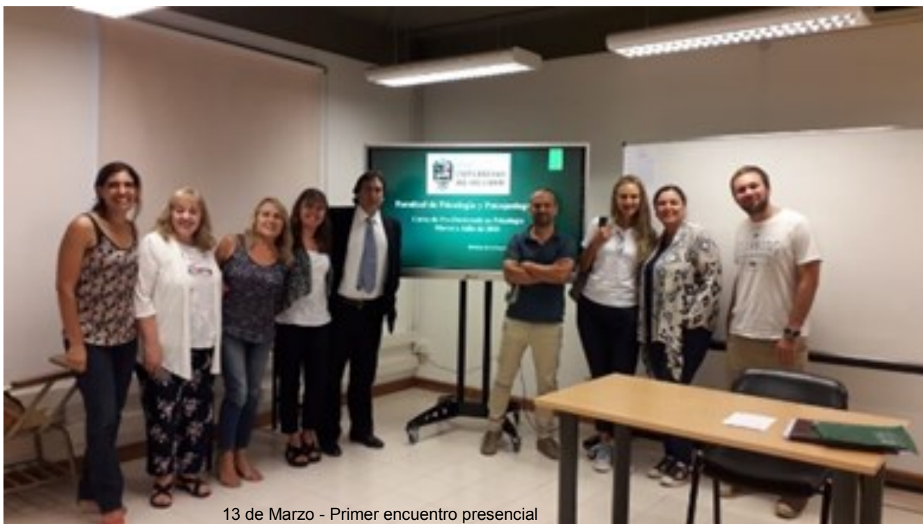
13 de Marzo - Primer encuentro presencial

El primer encuentro se realizó de manera presencial, pero producto de la pandemia Covid19 y de la cuarentena decretada a partir del 20 de Marzo, los encuentros restantes se realizaron de manera virtual. El cambio de modalidad de dictado no obstaculizó el desarrollo normal del curso. Las adecuaciones de la modalidad a distancia permitieron completarse en su totalidad. De esta manera, se logró facilitar la accesibilidad de la Carrera de Doctorado a nuestra comunidad académica y profesional en la Sede Pilar.